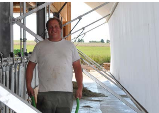
△ Das Einstreuen der Strohbuchten übernimmt eine automatische Einstreuanlage mit drei Kreisläufen. Damit können sie je nach Bedarf eingestreut werden.

Der Kuhplatz kommt auf ca. 11 500 €. Da sie mit ihren Tieren aus dem Anbindestall kommt, konnte sie in Bayern über das BaySL-Programm eine Förderung von 30 % auslösen.