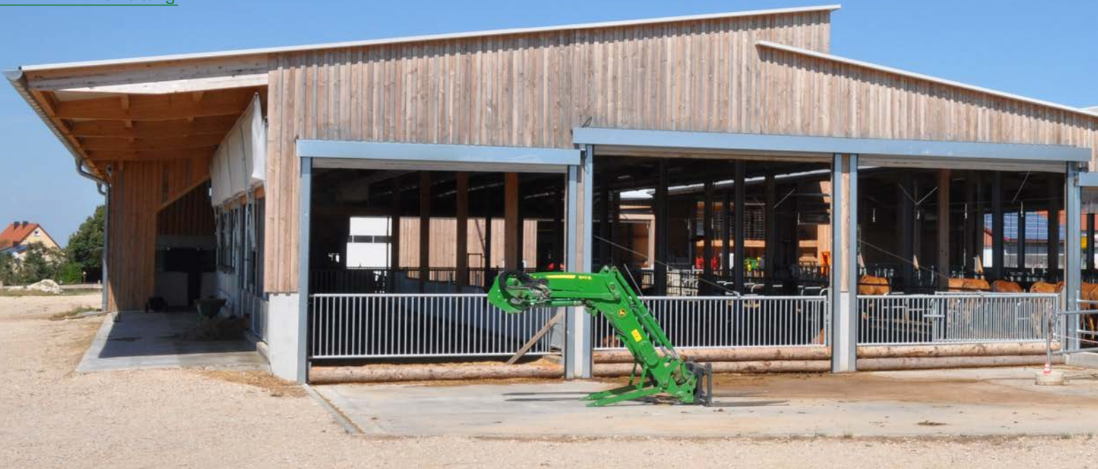
△ Der mehrhäusige Sheddach-Stall lässt sich auf allen Seiten über Curtains und mit einem speziellen Windschutz schließen.